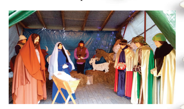
Szopka w Kościele w Słupii Nadbrzeżnej

Szopka w Kolegiacie Św. Marcina w Opatowie