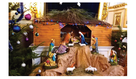
Szopka w Parafii Wszechświęte we Wszechświętych