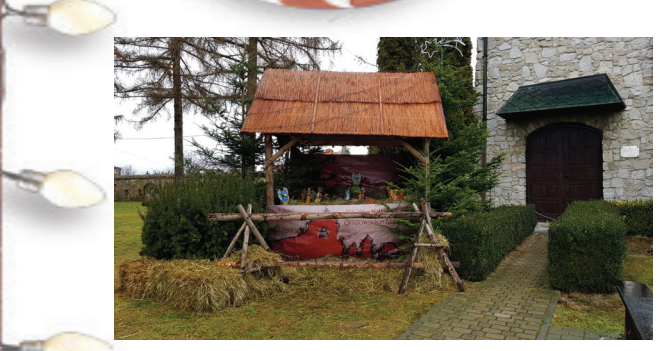
Szuoka przy Klasztorze Ojców Bernardynów w Opatowie